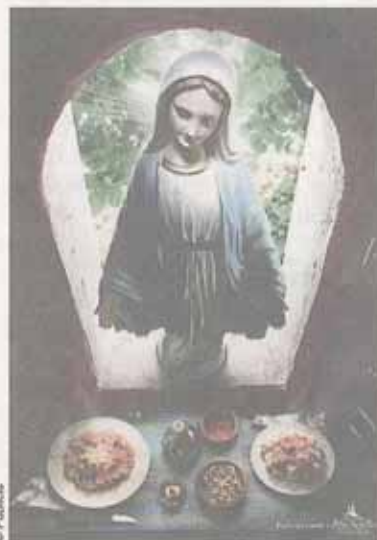
Echt würziges Essen: die Madonna steht auf Salsa Picante.

Die Kampagnen müssten vor allem eines haben, wenn sie am hiesigen Markt erfolgreich sein wollen: Emotionen.