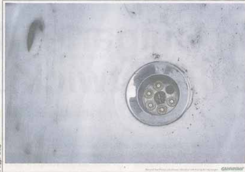
Die Waffe wider die Natur: Die Romania Bigger Group inszeniert für Greenpeace.

„Coca-Cola etwa hat in Bukarest einen wichtigen Standort für den gesamten Raum, von Bulgarien bis Griechenland.“ Die größten Werber, gemessen an den Ausgaben, sind in Rumänien in neun von zehn Fällen internationale Konzerne. Procter & Gamble etwa führt die Rangliste mit einem Werbe-Budget von 132 Mio. € (Stand laut AWO aus dem Jahr 2004) an. Dahinter fol-